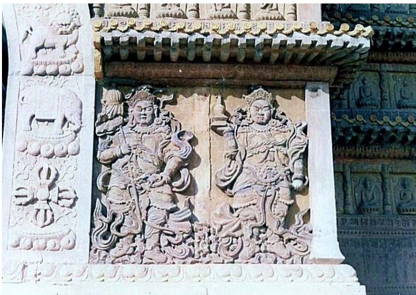
Pod vchodovým klenutím se na obou stranách nachází další sochy-plastiky dvou párů Nebeských králů , kteří svým zjevem návštěvníka spíš zastraší, než aby vybidli ke spočinutí na tomto posvátném místě

Jazyky blízkého východu pak hovoří o prorocích, naplněných Duchem svatým...“ 1